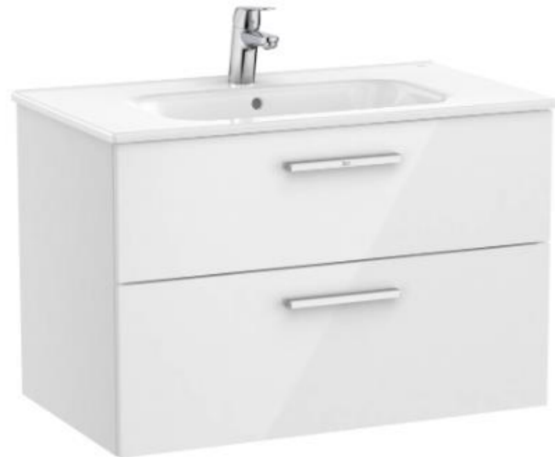
LAVABOS ASEOS ROCA.