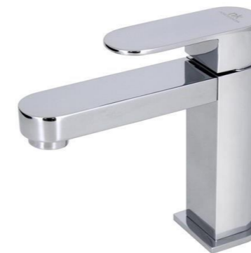
GRIFERIA DE LAVABO SERIE HOTELS