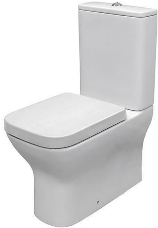
INODORO A SUELO URBAN C