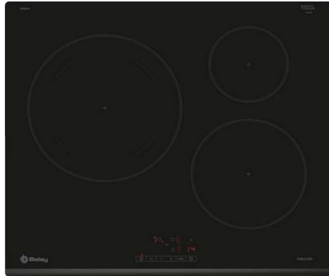
Placa de inducción, 60 cm 3EB865FR