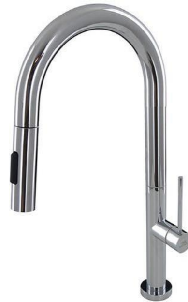
GRIFERIA FREGADERO SERIE URBAN STICK